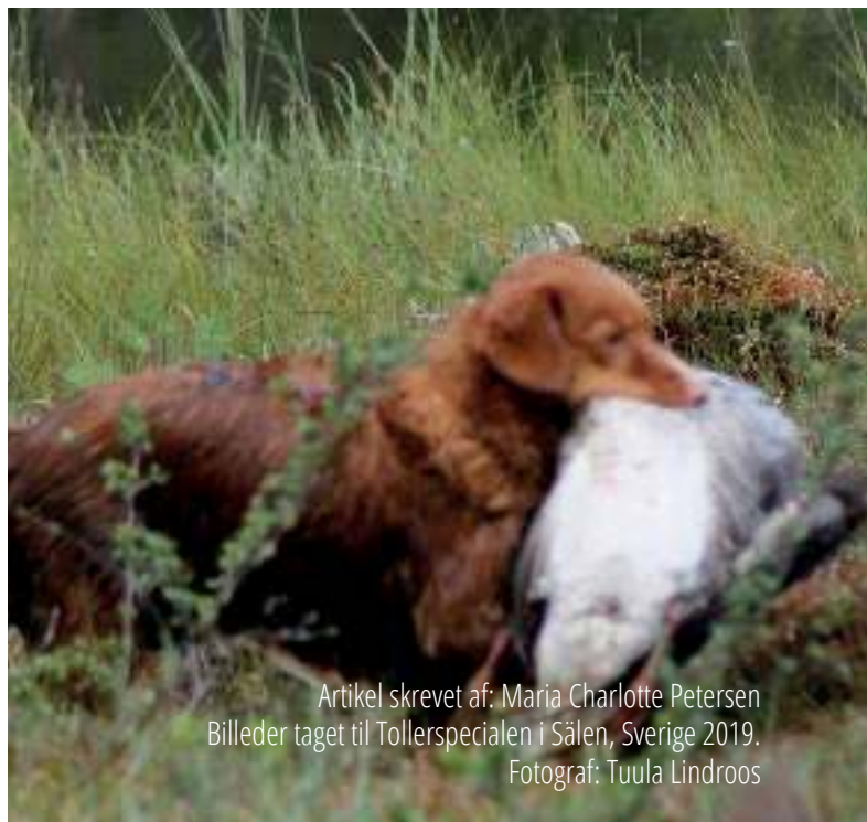
Artikel skrevet af: Maria Charlotte Petersen Billeder taget til Tollerspecialen i Sälen, Sverige 2019.