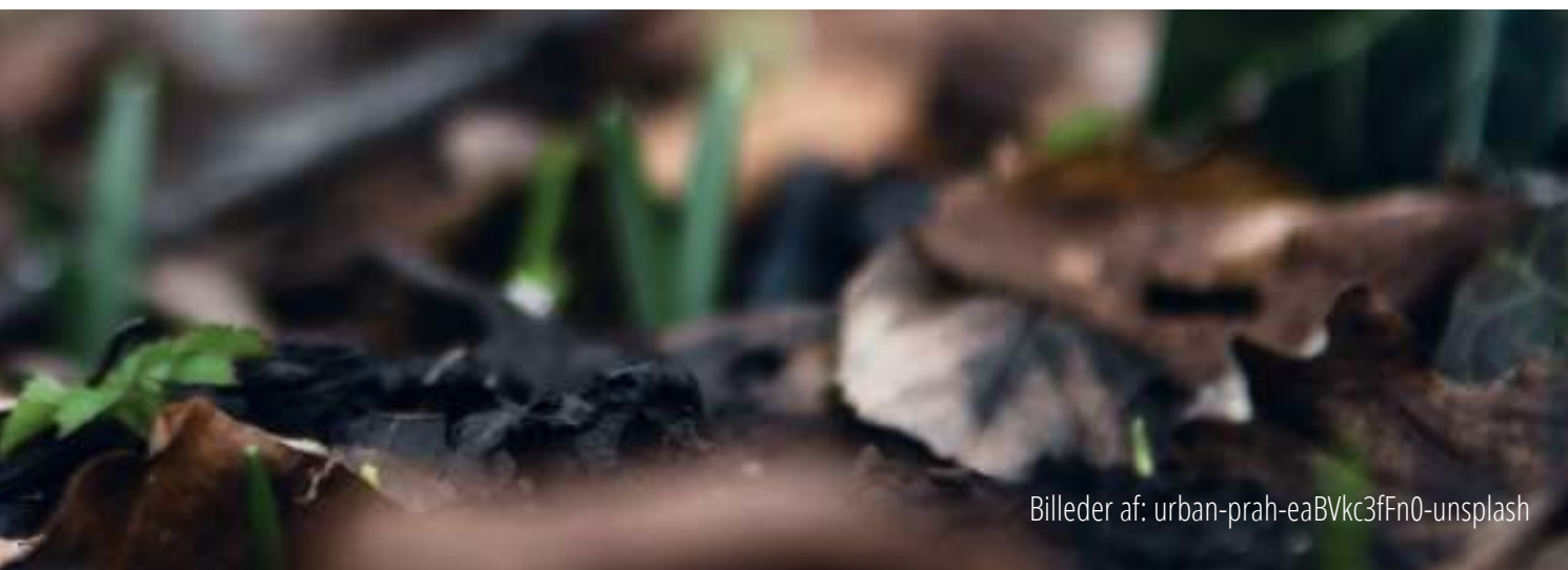
Billeder af: urban-prah-eaBVkc3fFn0-unsplash