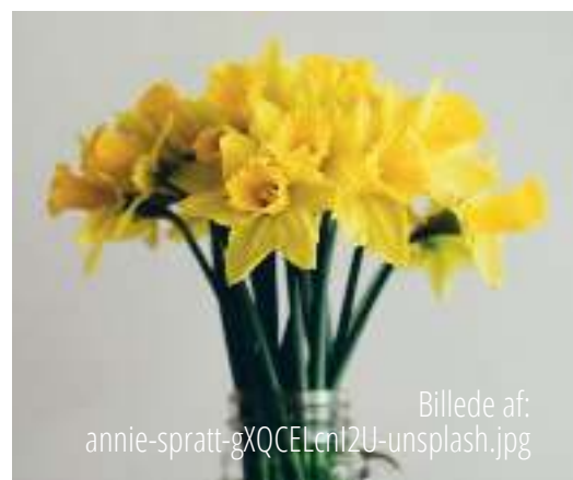
Billede af: annie-spratt-gXQCElnt2U-unsplash.jpg