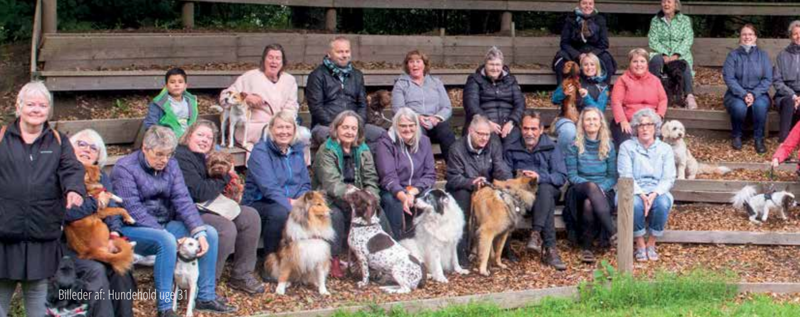
Billeder af: Hundehold uge 31