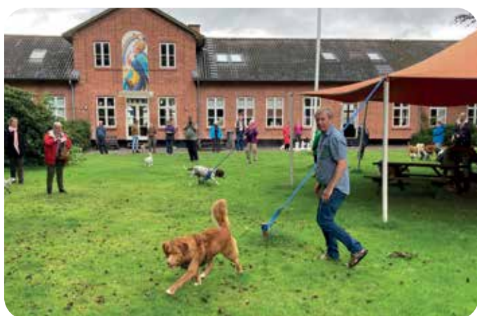
Billede: Ankomst til højskolen