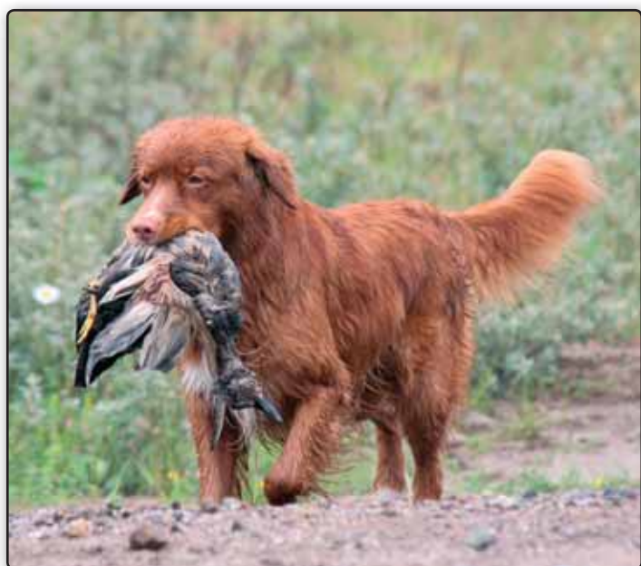
En stolt toller med et perfekt greb ved prøven i Gammelrand