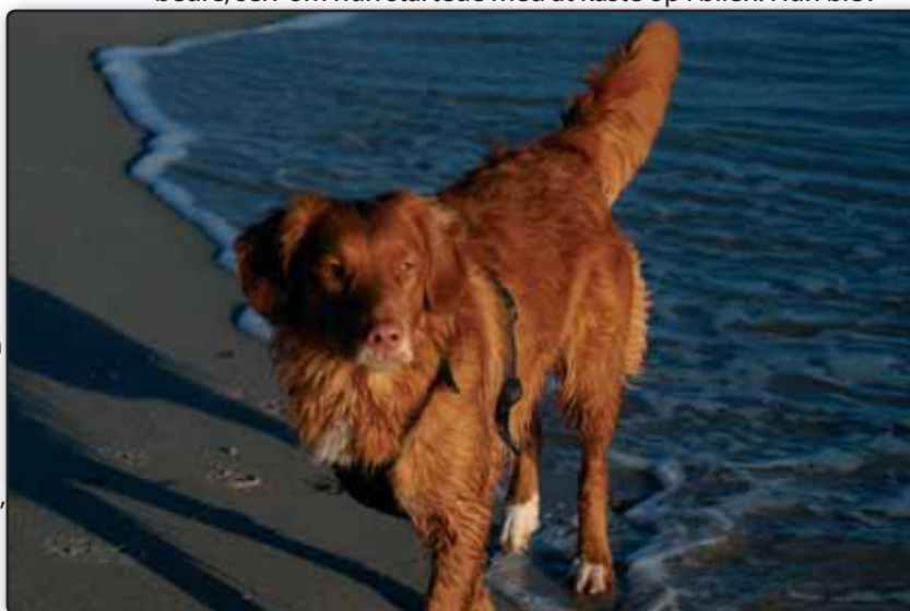
Flora var tæt på at dø

Jeg hentede hende igen onsdag, og hun havde det klart meget bedre, selv om hun startede med at kaste op i bilen. Hun blev