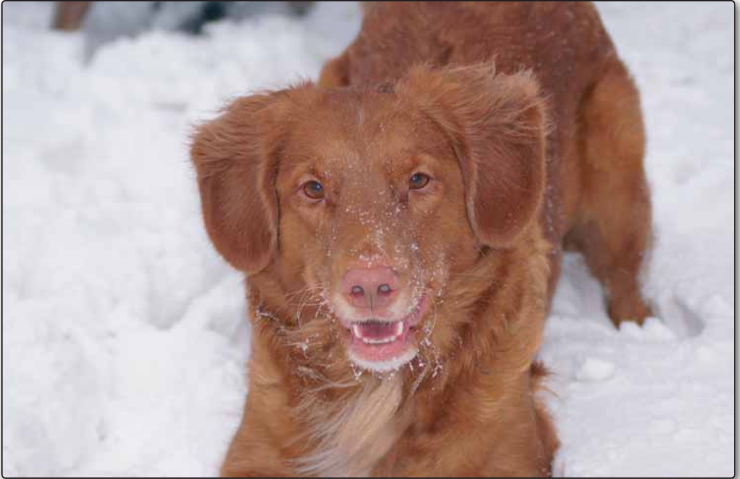
Flora er heldigvis fit for fight igen

Vi skulle på sommerferie i juli 2017 med vores 5 hunde og autocamper til Sverige, men weekenden før var camperen gået i stykker, så vi udskød ferien lidt. DET var heldigt.