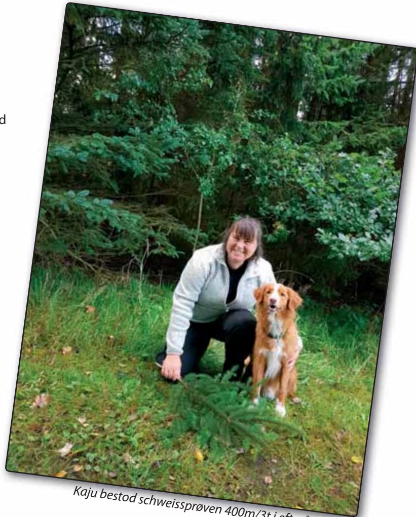
Kaju bestod schweissprøven 400m/3t i efteråret 2017

Jeg studsede godt nok lidt over underteksten: "It's not about the dog". Det handlede 100 % om mig og mit syn på verden, og hvad jeg havde med i den mentale rygsæk fra barndommen. Om at få væltet de gamle skeletter ud af skabene og få afsluttet alle de gamle tåbelige ting, som jeg brugte al for meget energi på at brokke mig over og have dårlig samvittighed over. At vide, at jeg selv kan ændre det meste i mit liv, bare ved at "tage nogle andre og positive briller på" er en kæmpe gave. At bruge krudt på at forsøge at fixe andre, mennesker som dyr, er omsonst! Skal noget ændres, kan kun du selv gøre det. Som Sosu-hjælper har jeg også på jobbet rigtig mange eksempler på ting og rammer, jeg ikke kan ændre på.