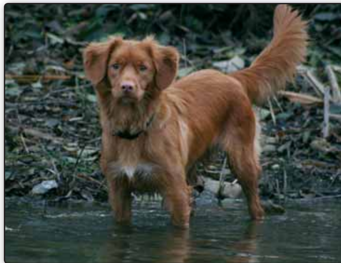
Tollere og vand hører uløseligt sammen