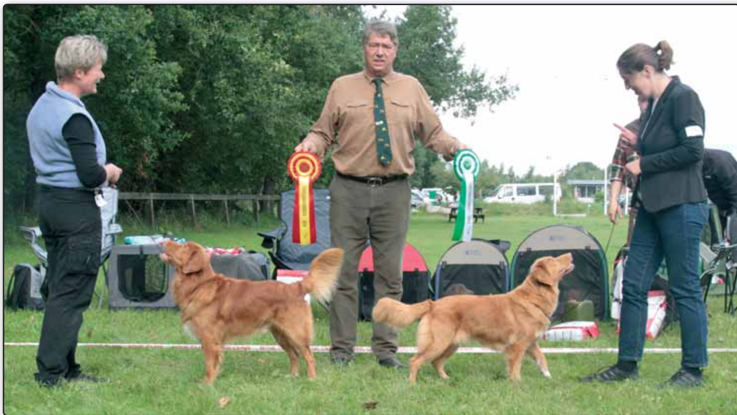
BIR og BIM. Fyn