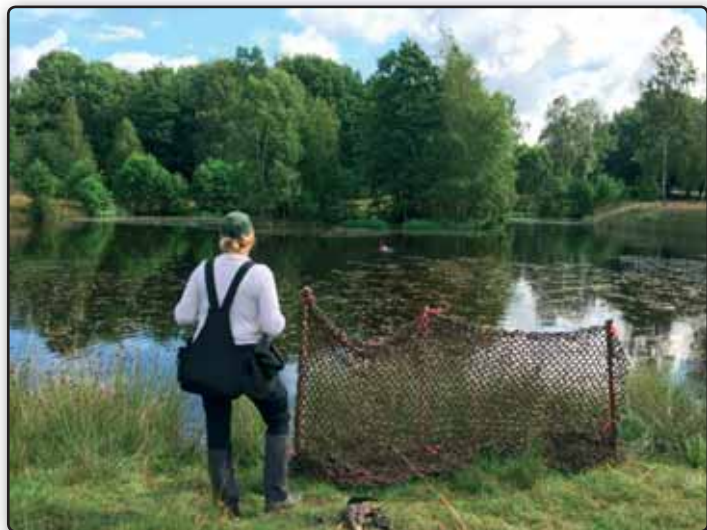
Tollerspecialen i Sverige gav mange udfordringer til hundene

Især Tollerspecialen var en stor opgave for arrangørerne. Over 150 tilmeldte hunde til de forskellige discipliner må have givet store udfordringer til mandskab. Jeg dømte åbenklasse ved en dejlig skovsø med masser af udfordring, sivbevoksede kanter, en lille ø, hvor der var godt med busket og omkransende sivskov, langhåret græs og især masser af vandpileurt i søen. Det eneste faste element var en fremragende prøvelægger, som havde lagt en god, varieret prøve med masser af jagtlige udfordringer. Forskellige træningsteams udgjorde hjælperkorpset. Så vi fik besøg af forskellige svenske teams, et norsk og et tysk team i løbet af de to dage.