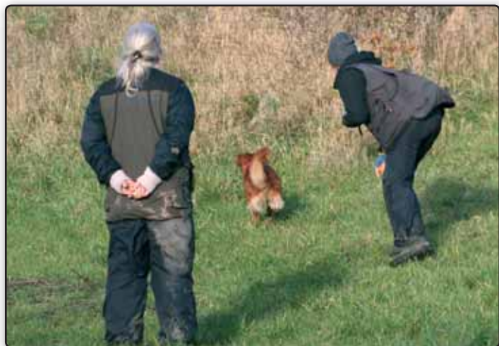
Et spændende terræn