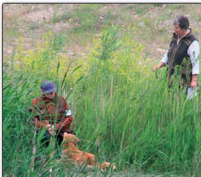
Der er smukt i området ved Gammelrand