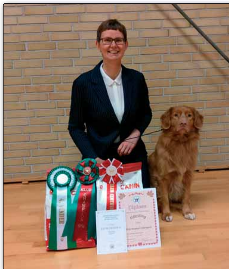
Klub Veteran Champion (KLBVCH) Digby Tollers Buckshot - "Hannibal" DK07225/2009 Ejer: Christine Nørskov Sørensen Opdrætter: Tina og Agneta Joonas, Sverige