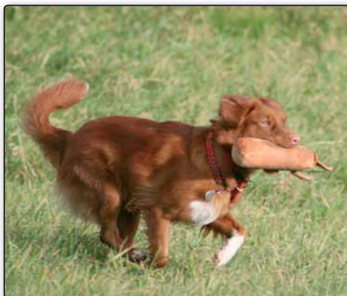
Et perfekt greb og så hurtigt tilbage til "mor"