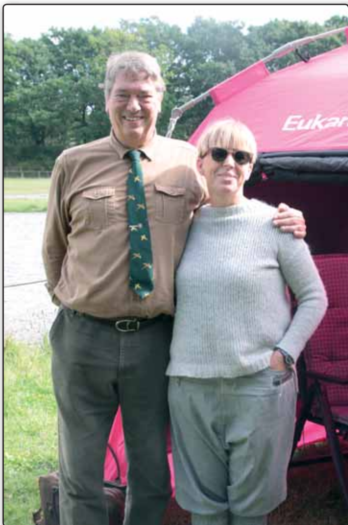
Dommer og sekretær. Fyn