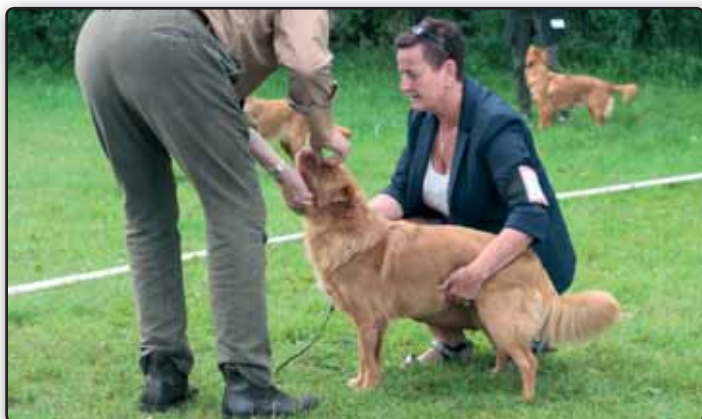
CERT-vinder tæve. Fyn