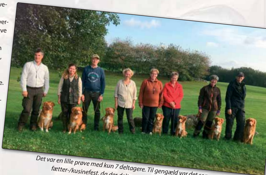
Det var en lille prøve med kun 7 deltagere. Til gengæld var det som en skandinavisk fætter-/kusinefest, da der deltog tre svenskere, en nordmand og tre danskere.