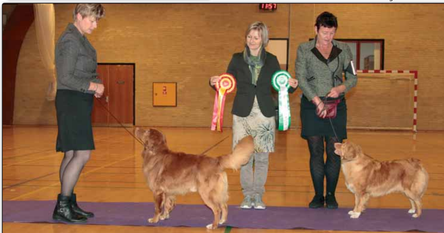
BIR og BIM. Vemmelev