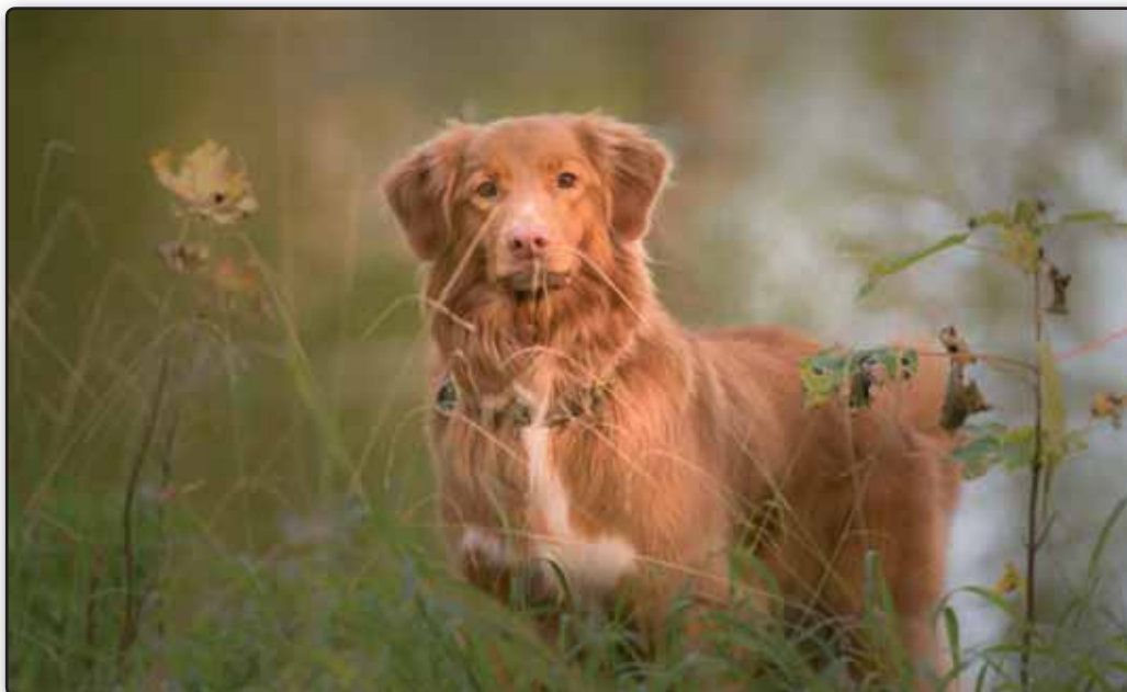
Mariendals Rednose Snooki Atka - aka Findus

På dette tidspunkt var der dog stadig flere internationale konkurrencer tilbage, og det var ikke til at vide, hvor mange konkurrencer som pludselig ville dukke op.