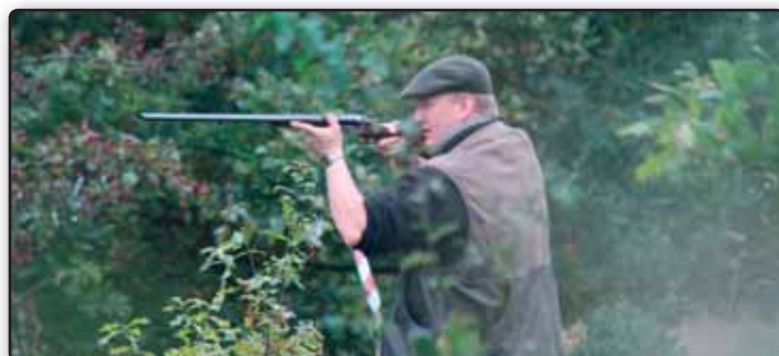
Kim havde en fantastisk træfsikkerhed. Han ramte alt - både dummyer og ænder 😊