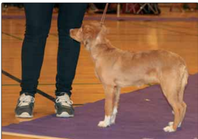
Bedste Baby. Vemmelev