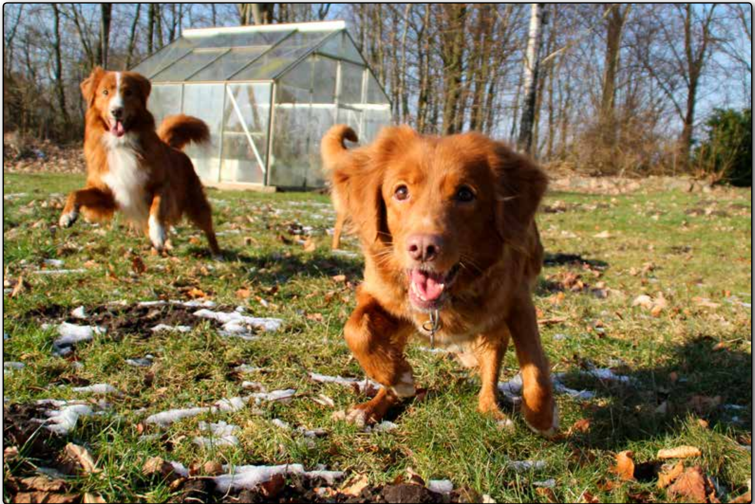
Mariendals Red Nose Turbo Kiara (Kia)