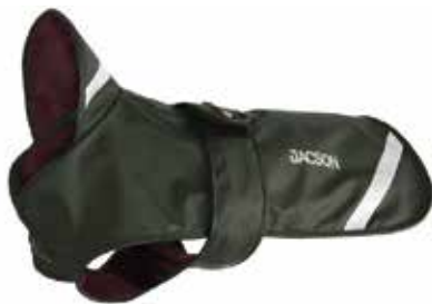
Pippi hundedækken fra Jackson