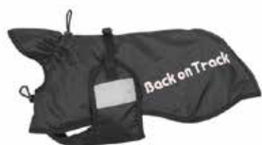
Back on Track

Andre mærker jeg er stødt på er WeatherBeeta, Siccaro Wetdog, Ezydog og Scruffs og lur mig om der ikke er mange mange flere.