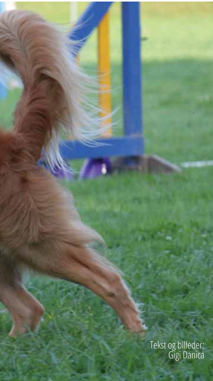
Tekst og billeder: Gigi Danica

udstilling, jagtprøver og agility, men som deler fællesinteressen, tollereren. Derfor, har jeg lavet et tema "Mig & min toller" til dig og din toller som laver noget helt andet sammen eller måske handler det om lille pippi på 11 år, som træner tollereren Olaf og det er hun blevet super god til osv. Det er DIN historie vi skal høre!