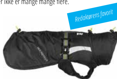
Hurttas Summit Parka